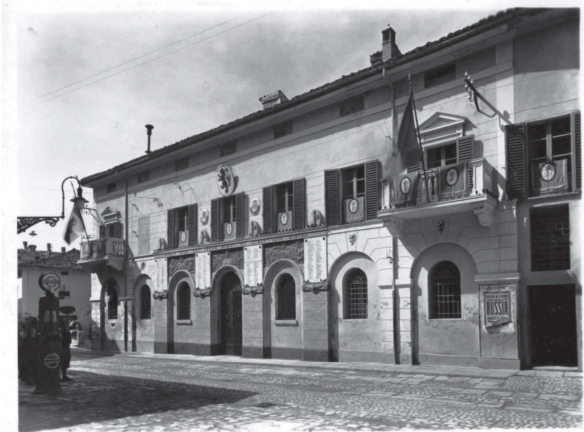
LOIANO ANNI '30 - La vecchia sede del Comune.