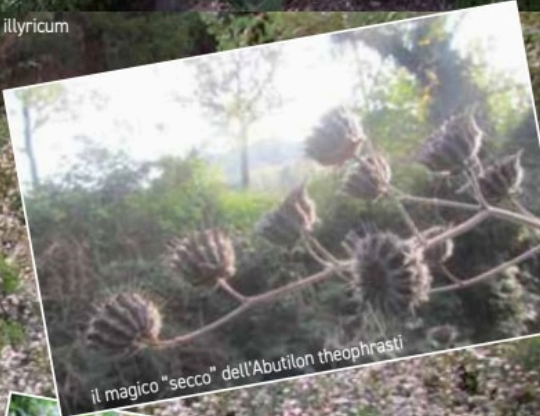
il magico "secco" dell'Abutilon theophrasti